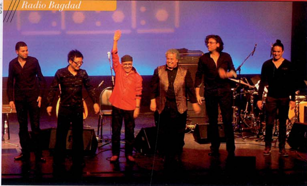
Avec son groupe.

productive, qui a finalement accouché de deux projets passionnants : "Noces Bayna" d'une part, en direction d'un public enfant ou familial, et ce dernier tout nouveau, plus "moderne", "Radio Bagdad" ?